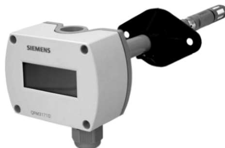
б) модификации с LCD дисплеем QFM3160D, QFM3171D