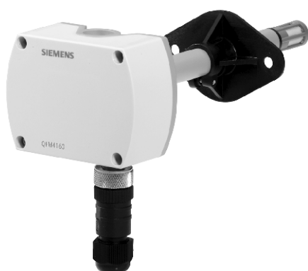
а) модификации QFM4160, QFM4171