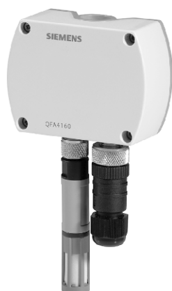
а) модификации QFA4160, QFA4171