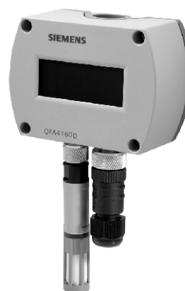
б) модификации с LCD дисплеем QFA4160D, QFA4171D