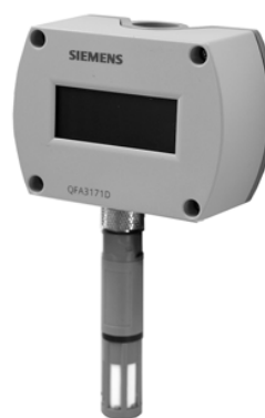
б) модификации с LCD дисплеем QFA3160D, QFA3171D