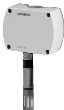
а) модификации QFA3160, QFA3171