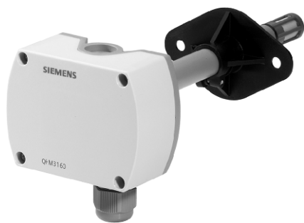
а) модификации QFM3160, QFM3171